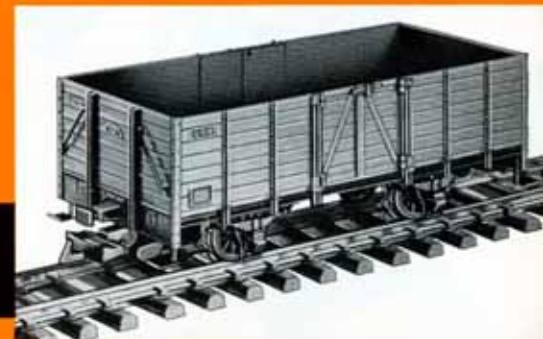
Offener Güterwagen Ow 368 der Härtsfeldbahn, braun DM 19,50 4021 Offener Güterwagen , grün DM 19,50