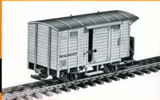
Geschlossener Güterwagen Gmag 501 der Zillertalbahnhof, weiß (Magnesium-Transport) DM 28,50