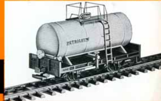
Kesselwagen R 360 der Zillertalbahnhof mit Füll-Öffnung und Ablaufhahn DM 34,50