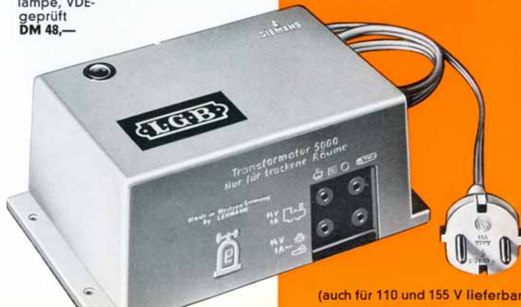
5000 Transformator, Anschluß 220 V Wechselstrom, Kurzschlußschalter, Kontrolllampe, VDE-geprüft DM 48,—