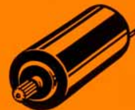
2100 Ersatzmotor für Lokomotiven DM 15,—