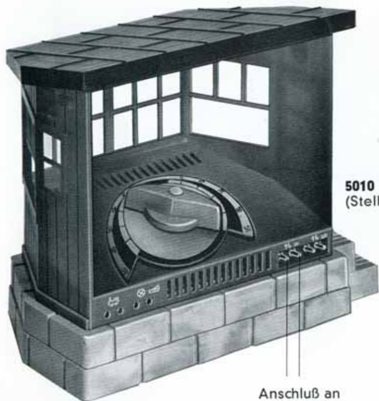
5010 Fahrregler (Stellwerk) DM 19,50