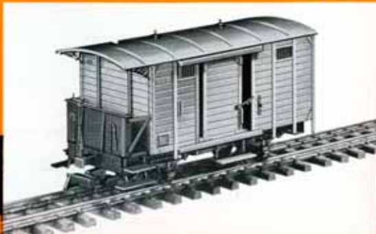
Geschlossener Güterwagen G 40 der Salzkammergut-Lokalbahn, braun DM 28,50