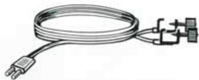
5016 Anschlußkabel, 1000 mm lang (Regler/Schiene) DM 3,—