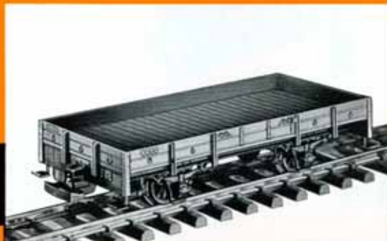
Niederbordwagen Nwr 4101 der Salzkammergut-Lokalbahn, braun DM 17,50 4011 Niederbordwagen , grün DM 17,50