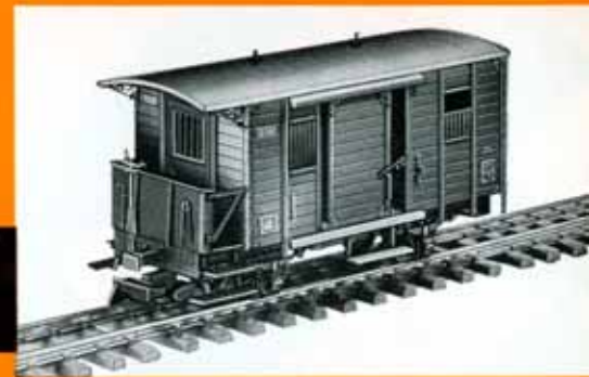
Gepäckwagen , grün, Pw 274 der Pinzgauer Lokalbahn DM 28,50