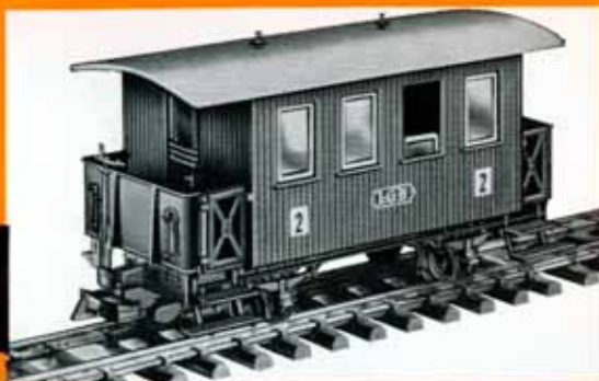
Personenwagen , braun, BCI 113 der Niederösterr. Landesbahn DM 28,50