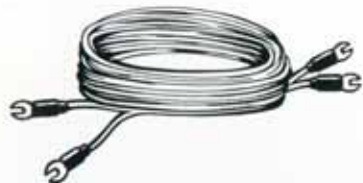
5015 Verbindungskabel, 5000 mm lang (Trafo/Regler) DM 3,—