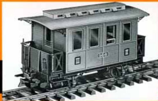
Personenwagen , grün, A 48 der Salzkammergut-Lokalbahn DM 32,50