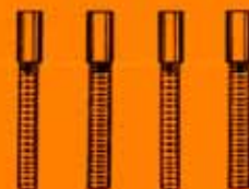
2110 Ersatz-Kohlebürsten 4 Stück DM 2,—