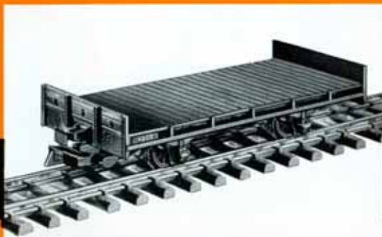
Plattformwagen Prd 3351 der Salzkammergut-Lokalbahn, schwarz DM 14,50 4001 Plattformwagen , grau DM 14,50